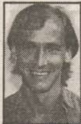
Door Rob Oostelbos

Hij zegt het na lang aandringen. Alsof hij er zich voor schaamt dat anderen hem goed